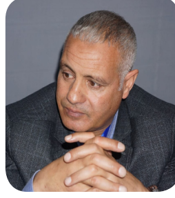
الوطنية بريس شيكى عبد اللطيف

يهدف الإقتصاد التعاوني أو التضامني إلى تحقيق أهداف ذات بعد تنموي، كذلك تحقيق فوائد مشتركة، والحفاظ على استمرارية النشاط،