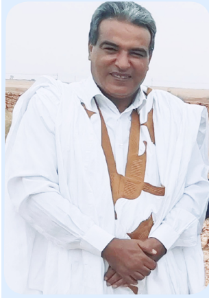
بقلم الدكتور سدي علي ماء العينين

تقلباتها، قد تسقط في عيون الناس وأنت لازلت واقفا، لكنك حين تسقط فعلا، فأنت أول من ستسقط في عيونه! فاحذر أن تسقط في عيونك، لأنك ستفقد الرضا عن نفسك، ولن يجديك رضا الناس عنك. أنت خليفة الله لم تخلق لترضى خلائق الله ولكن لترضى عن نفسك حين تحس برضى الله. تعلم الجلوس على الصخور قبالة البحر او في الوديان، و سترى حجم قوة الصخور التي تنحتها أمواج البحار من الأزل، وقوة حجر الوديان مهما تلاعبت به سيول الوديان كلما زادته لمعانا وبريقا من مكان الى مكان. لماذا ننظر دائما من الخالق العطاء، ونقابله بالجفاء؟ لأنه لا يتضرر ولا ينتفع بظاعتنا له نتغافل عنها؟ ولما نصر أن عطاءه شيء بديهي؟ أليس الله كرب المعمل ومدير الشركة والمدرس في الفصل، تنتظر منهم الزيادة في الأجور أو أحسن النقط في الفصول، ومن أجل ذلك تبدل أكبر المجهود، وتنافس أقرانك في الفصل والعمل لتحل الرتب الأولى وترتقي مهنيًا ، وكل غايتك أن ترضي مرؤوسيك حتى تكون لك عندهم حظوة وتنال من عطاياهم في الترقية وتقلد المهام، وفي