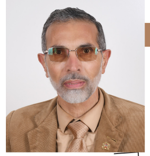
الوطنية بريس حميد عسلاوي