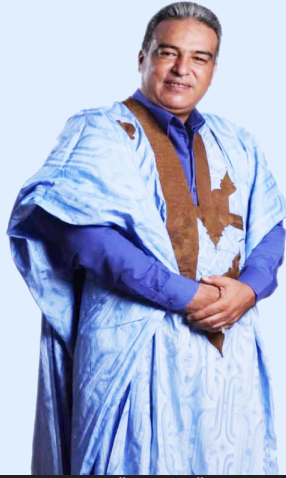
بقلم الدكتور سدي علي ماء العينين مهتم بالشأن الصحراوي

المغرب المستعمرة السابقة لفرنسا و اسبانيا، والتي تواصل استنزاف خيرات