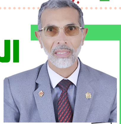
الوطنية براس حميد عسلاوي

قال تعالى « وجعلنا من الماء كل شيء حي » والصلاة والسلام القائل: « إذا قامت الساعة وفي يد أحدكم فسيلة فليغرسها » وبعد، فيشير مصطلح الحفاظ على البيئة إلى الإجراءات التي يتم اتخاذها لحماية كوكبنا والحفاظ على موارده الطبيعية من التلوث، ومفهوم الحفاظ على البيئة يقوم على عكس آثار التزايد السكاني والتطور الصناعي المدمرة للبيئة، والعمل على الحد من تدهور النظام البيئي لتجنب الآثار الكارثية التي قد تصل إلى فناء الأنواع وانقطاع المصادر الحيوية. أو بعبارة أخرى تعني الممارسات التي تقوم بها كبتير بهدف إنقاذ البيئة من تدمير النظام البيئي بسبب التلوث والأنشطة البشرية، ويكون ذلك إما على المستوى الفردي من خلال الإجراءات التي يتخذها كل فرد لوجهه بهدف حماية البيئة أو على المستوى الحكومي أو الدولي.