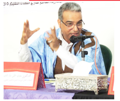
بقلم الدكتور :سدي علي ماء العينين

اتابع بألم شديد ما يكتبه إخواننا المغربية عن إخواننا بتندوف، والألم الأكبر حين اتابع ماينجز من تنمية في عهد الملك محمد السادس لفائدة الأقاليم الجنوبية ، وما يعيشه أبناء عمومنا بتندوف من قهر وعوز وتهميش. اتألم، وأنا من كنت عضوا ممثلا للشبيبة الاتحادية في محفلين شبابيين بكل من اليونان وفينزويلا، وعانيت بألم عيني حجم الرفاهية التي تعيشها قادة البوليزاريو بأوروبا على حساب ساكنة تندوف، و جالست أبناء عمومي بفينزويلا من الأطفال الذين ترعرعوا بين أحضان دول أمريكا اللاتينية بعيدا عن أسرهم وقبائلهم، وتمت المتاجرة بمعاناتهم ويتمهم القسري، و اتألم من أعماق قلبي للنساء في الداخل اللواتي وجدن في فترات نظام العسكر بالجزائر من أموال تصلهن باحياء العيون ملاذهن للتعبير عن نكسات نفسية وقهر قلبي بسبب العنوسة و قهر الرجال، فيخرجن للمظاهرات لسويغات يرددن: لا بديل لا بديل عن تقرير المصير. أمام كاميرات هواتفهن ، وبعدها يعدن إلى بيوتهن و يجلسن إلى كأس شاي بطعم الإنتصار !!!