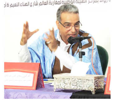
الوطنية بريس الدكتور سيدي علي ماء العنين