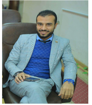
■ بقلم/ هيثم عبد الرحيم باحث في مقارنة الأديان

امرأة اشتكت إلى النبي الكريم وقد سمع شكواها الله جل جلاله: «إن زوجي تزوجني وأنا شابة، وذات أهل ومال وجمال، فلما كبرت سني، ونثر بطني، وتفرق أهلي، وذهب مالي، قال لي: أنت علي كظهر أمي، ولي منه أولاد، إن تركتهم إليه ضاعوا، إن ضمتهم إلي جاعوا»، أنا أربيهم، وهو ينفق عليهم، إذا هناك دوران متكاملان بين الأب والأم، الأب يكسب الرزق، وينفق على أولاده، والأم تربي. — هناك مؤسسات ثلاثة لتربية الأولاد، أول مؤسسة: الأسرة، وثانيها: المدرسة، وثالثها: الإعلام، فأي مجتمع أسرته غير منضبطة، والمدرسة غير منضبطة، والإعلام غير منضبط، فهناك أجيال تلو أجيال تكون عبئاً على الأمة، وليست في