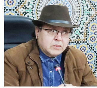
بقلم: محمد أمين النظيفي

لماذا تراجع دور الجيران في تنبيه بعضهم لما يصدرون عن أنفائهم من ممارسات بل يتعدى ذلك إلى زجر كل من سولت له نفسه الخروج عن قواعد و مبادئ حسن الجوار لماذا تخلت و سائل الإعلام الرسمية عن دورها في التعريف بتاريخ الوطن و ما خلفه السلف من موروث الثقافي كمؤشر لعظمة السلف مساهمة منه ترسيخ القيم الوطنية و المواطنة الحققة التي هي مدعاة للفخر و الاعتراز