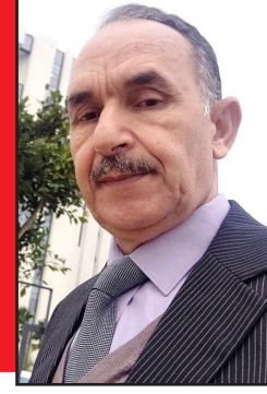
بقلم: عبد السلام العزوي