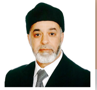
بِقلم / د. حسن الجامعي

الحمد لله الذي لا يحمد على أمر سواه، والصلاة والسلام على نبيه ومصطفاه، وعلى آله وصحبه ومن والاه.